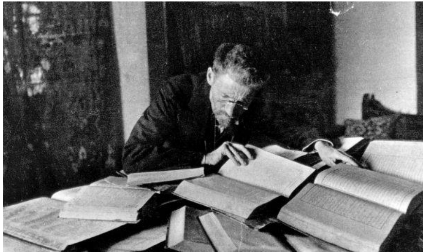
Govva 1. Ben-Zion Ben-Jehuda (Itamar Ben-Avi, 1882–1943), vuosttaš dálá hebreagiela eatnigielhálli.