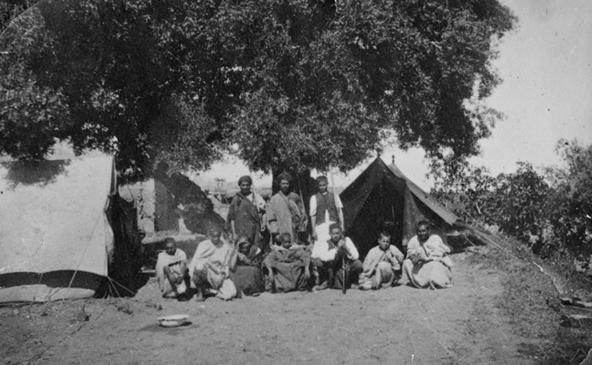
Edvard Westermarcks läger i Amzmiz vid Stora Atlasberget under ett av hans fältarbeten i Marocko 1904.