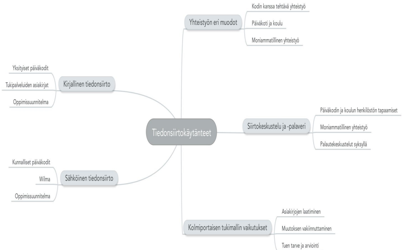
Kuvio 3. Tutkimuksen tulokset tiedonsiirtokäytännöistä tukea tarvitsevan oppilaan kohdalla

Tämän tutkimuksen tarkoituksena on selvittää mitkä ovat tiedonsiirtokäytänteet tukea tarvitsevan oppilaan kohdalla siirryttäessä esiopetuksesta alkuopetukseen. Tässä luvussa esittelemme aineistolähtöisen sisällönanalyysin pohjalta saatuja tuloksia. Ensimmäisessä alaluvussa käsittelemme lastentarhanopettajien ja luokanopettajien käsityksiä tiedonsiirtokäytännöistä tukea tarvitsevan oppilaan kohdalla. Haastatteluissa korostuivat yhteistyön eri muodot, siirtokeskustelu ja -palaveri sekä sähköinen ja kirjallinen tiedonsiirto. Lopuksi tuomme esille kolmiportaisen tukimallin vaikutuksia tiedonsiirtokäytänteisiin, koska se on muuttanut toimintatapoja tiedonsiirrossa sekä tuen antamisessa. Alla olevassa kuviossa 4 on esitetty tutkimuksemme tulokset kokonaisuudessaan.