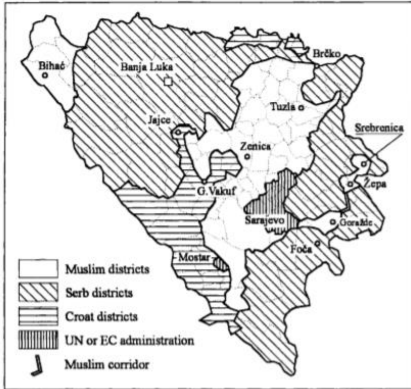
Map 6.3 Owen-Stoltenberg Proposal for Partition, August 1993

Liite 3, kolmen tasavallan rauhansuunnitelma eli Owen–Stoltenberg-suunnitelma.