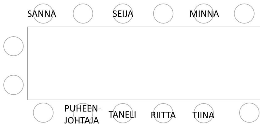
KUVA 3. Istumajärjestely esimerkissä (10).

Esimerkissä (10) osallistujat istuvat kuvan 3 osoittamalla tavalla.