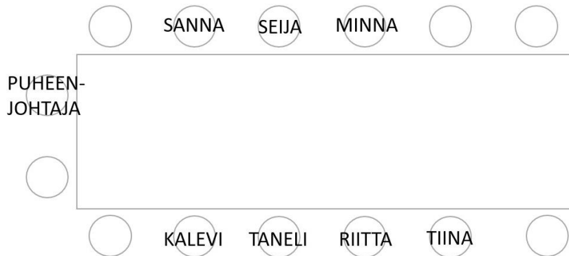
KUVA 2. Istumajärjestely esimerkissä (9).

Esimerkissä (9) osallistujat istuvat pöydän ääressä kuvan 2 osoittamalla tavalla.