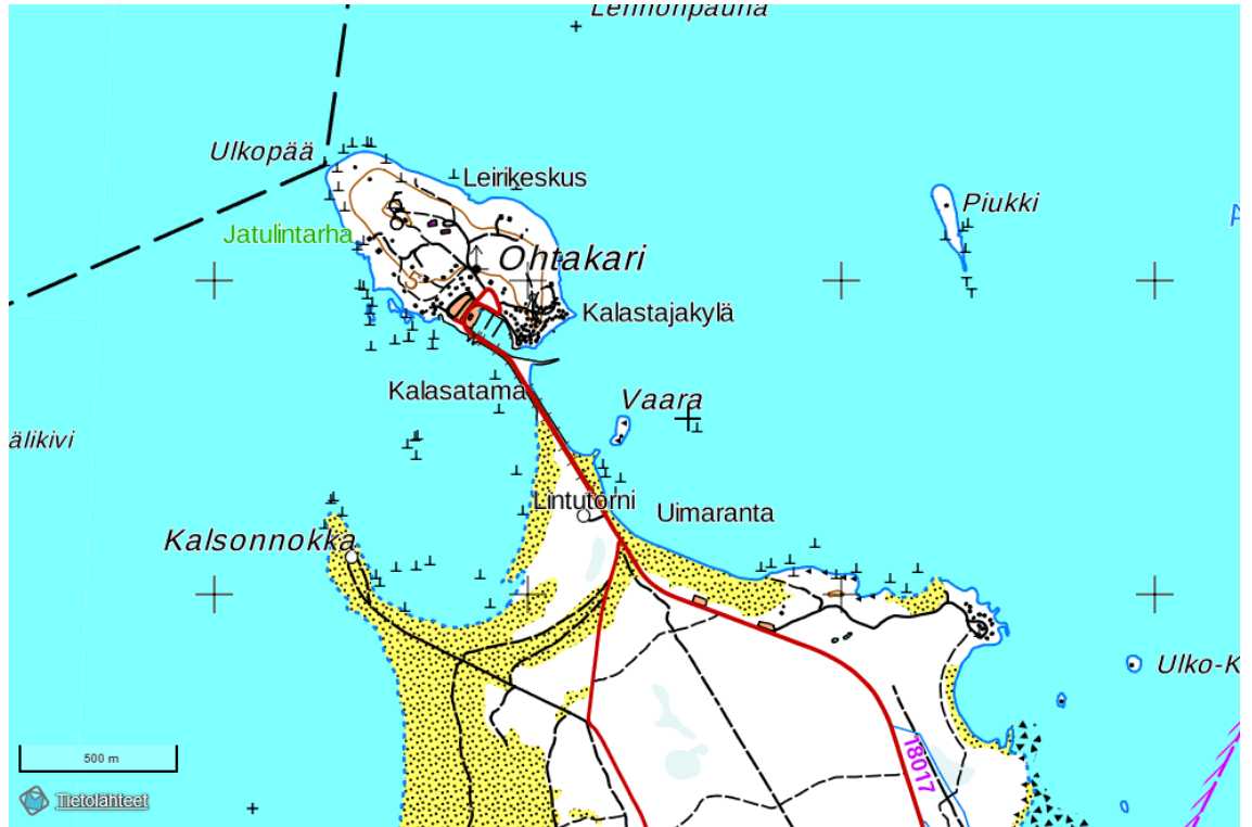
Kartta 3. Ohtakari, Kalsonnokka sekä Pitkänpauhan uimaranta 89