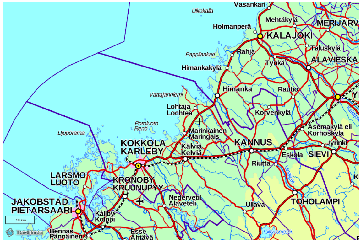
Kartta 1. Lohtaja ja Vattajanniemi 87