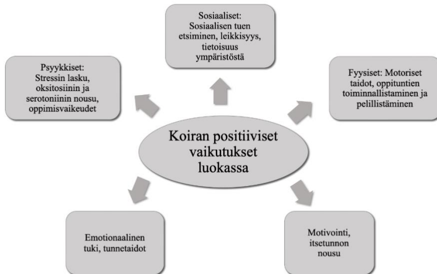
Kuvio 2. Koiran vaikutus luokassa oppilaaseen ja opetukseen perustuen tässä tutkielmassa havaittuihin seikkoihin.

sovellettiin paljon tietoa ulkomaisista lähteistä peilaten niitä suomalaiseen koulukontekstiin. Koiran huomattiin lisäävän ainakin oppilaiden itsetuntoa, motivaatiota ja sosiaalista vuorovaikutusta luokassa (Beetz, 2013; Boe, 2008; Glenk, 2017; Shaw, 2013). Lisäksi oppilaat oppivat koulukoiran avulla vastuun ottamista ja sen kantamista sekä sääntöjen noudattamista koulukoirasta omalla toiminnallaan huolehtien (Melson, 2005).